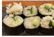
いかきゅう細巻き