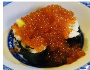
いくらこぼれ盛り