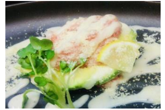
ねぎとろアボカドスライス