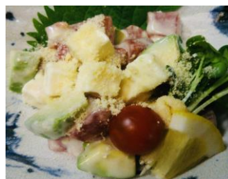
まぐろとアボカドのクリームチーズ和え