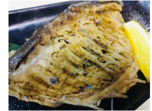
本まぐろヒレ焼き