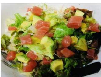
まぐろとアボカドのサラダ