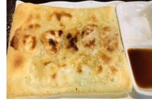
まぐろとエビの焼き餃子