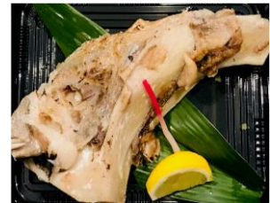
本まぐろカマ焼き