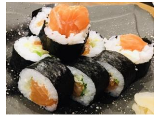
サーモンサラダ中巻