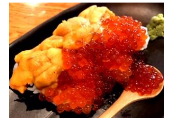
うにいくらこぼれ盛り