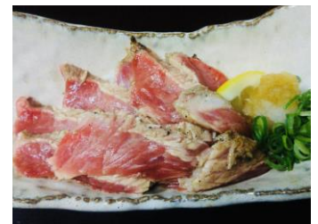
ほぼ肉たたきポン酢