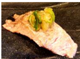
まぐろほほ肉炙り